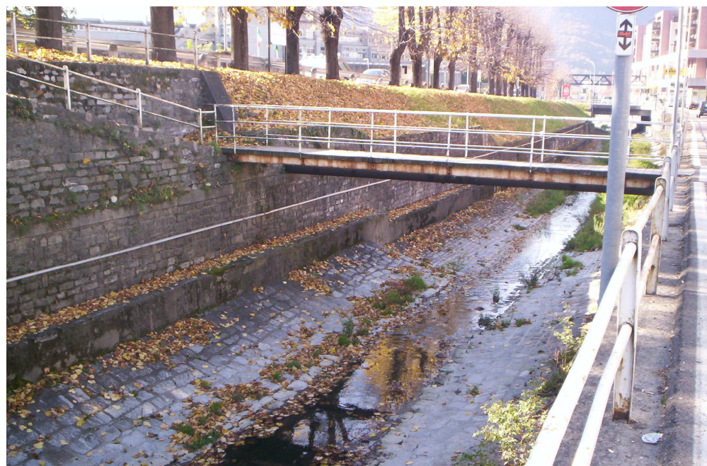
F1 - DOCUMENTAZIONE FOTOGRAFICA